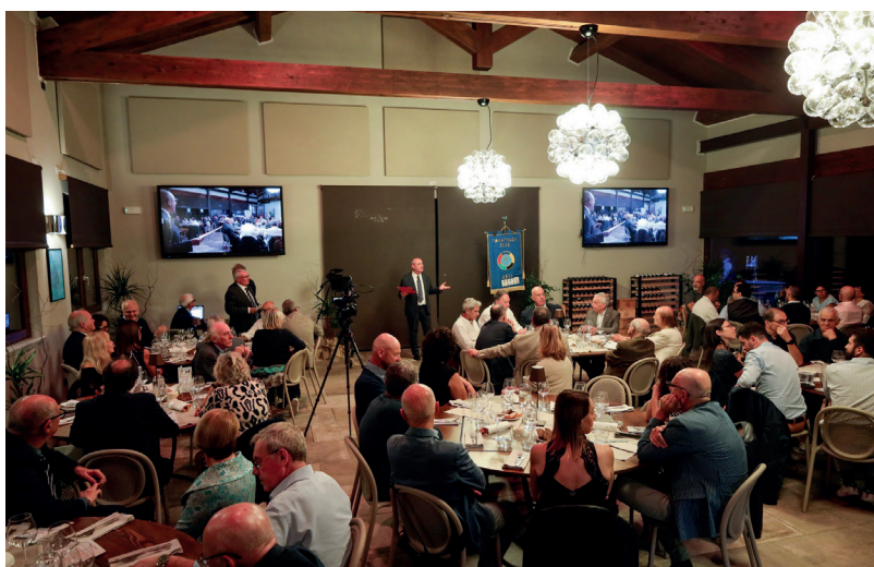
La sala del resort Casa Serra che ha ospitato la conviviale dedicata alla tre giorni Romana in occasione del “Giubileo degli Sportivi”