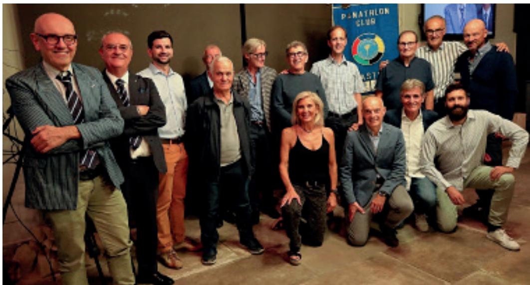
Foto di gruppo per i ciclisti che hanno raggiunto Roma pedalando in 5 giorni per complessivi 736 Km