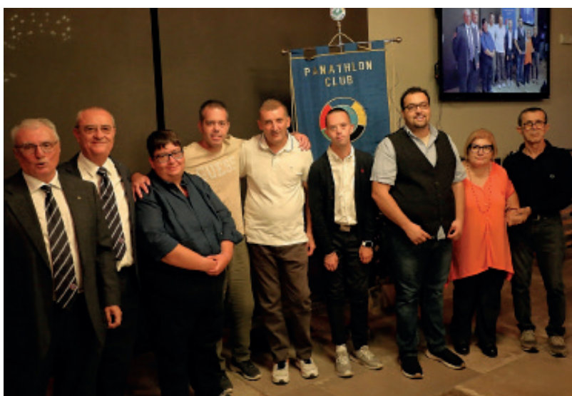
I ragazzi del GSH Pegaso presenti alla serata dopo essere stati tra i partecipanti alla gita a Roma svoltasi dal 10 al 12 Giugno